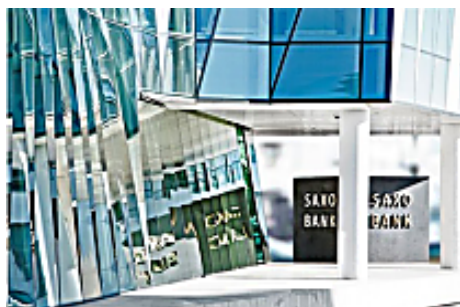
Changeons notre façon d'investir (Saxo Bank)