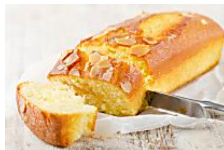
Gâteau au yaourt (Ma Vie En Couleurs)