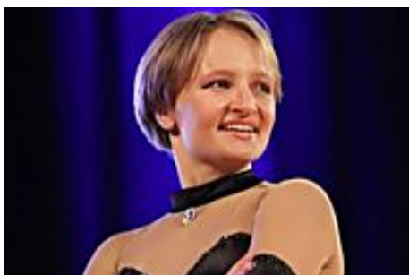
Vladimir Poutine : Découvrez sa fille, danseuse et milliardaire (Le Figaro)