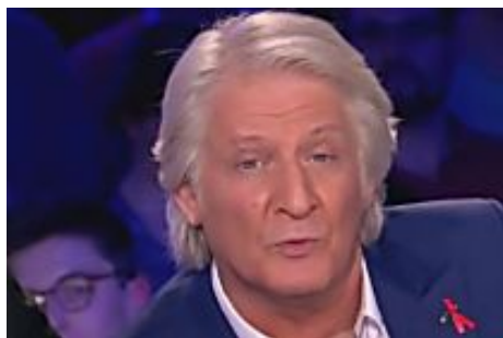
Fou de rage, Patrick Sébastien démolit Yann Moix (Orange)