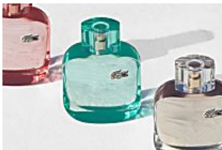
Idées de cadeaux : 3 fragrances qui s'adaptent à vos humeurs ! (Grazia pour Lacoste)